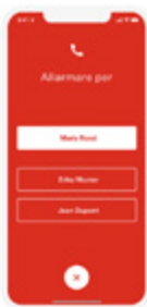
Allarmare per altre persone