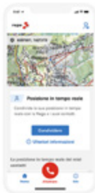
Condividere la posizione in tempo reale